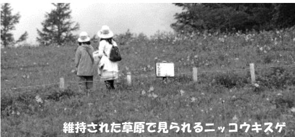
維持された草原で見られるニッコウキスゲ

夏に花を咲かせた草花の種が落ちた十一月、草原の草刈りを一斉に行います。草刈りが終わると、刈られたササやカリヤスモドキの葉が木枯らしで舞い上がり、初雪も間近です。草刈りは、キスゲ平に厳しい冬の始まりを告げる晩秋の風物詩です。