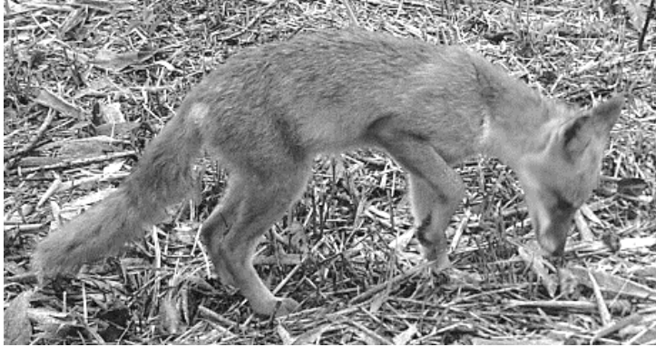
センサーカメラに映ったホンドキツネ

霧降高原の初雪は例年十一月中旬ですので、遅くとも十一月月上旬には冬用タイヤに履き替えおきたいところですが、十一月末まで路線バスは運行していますので、冬道の運転に自信のない方はバスをご利用ください。