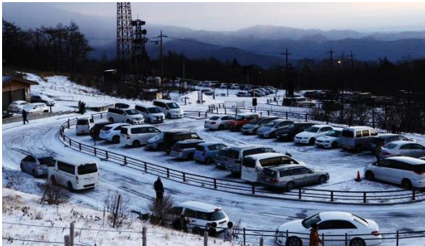
満車になった駐車場

大晦日に雪が降り始め、今年はダメかも…と不安でしたが、夜のうちに雪は止み、快晴に。例年以上の盛り上がりで、来場者は三百人以上！ 第三駐車場がいっぱいになる光景はキスゲのシーズン以来です。遊歩道に行列になってご来光を待ち、顔を出した瞬間の歓声は大きなものとなりました。来年も初日の出はキスゲ平で。