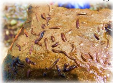
石の裏のプラナリア

復習をしましょう。プラナリアとはウズムシ目の総称で、再生能力が高く、切った分だけ増えるので、理科の教科書でよく扱われます。肉食で動物の死骸などを食べ、水質判定する際のきれいな水であるI級に分類されています。園内のこの小さな沢の水が、綺麗だという事をプラナリアが証明してくれています。