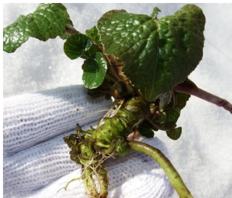
アブラナ科ワサビ ( Eutrema japonicum )

栽培されているわさびは栽培方法により二種類に分けられます。溪流などを利用して栽培する水わさびと、涼しく湿気がある畑で栽培する畑わさびです。水わさびのほうが根茎が大きく育つので、根茎を擦って食べる我々には水わさびのイメージが強いかもしれません。味はと言うと、擦るとわさびの匂いが出ましたが、肝心のツーンと来る辛みが少なく、マイルドなわさびでした。そしてわさびを取りに行った時に、わさびの葉が食われていました。もしヤシカが食べに来ているのではと思い、カメラを仕掛けてみました。