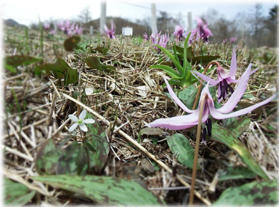
カタクリのピークは例年 4 月下旬から GW にかけて