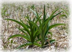
ニッコウキスゲの新芽